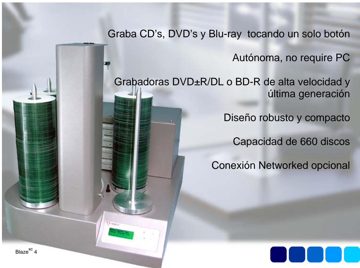
Blaze xc 4

Graba CD's, DVD's y Blu-ray tocando un solo botón