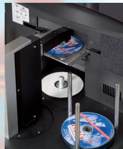
Vista del mecanismo robótico de la Omega

Soporta todos los formatos, incluyendo Doble Capa.